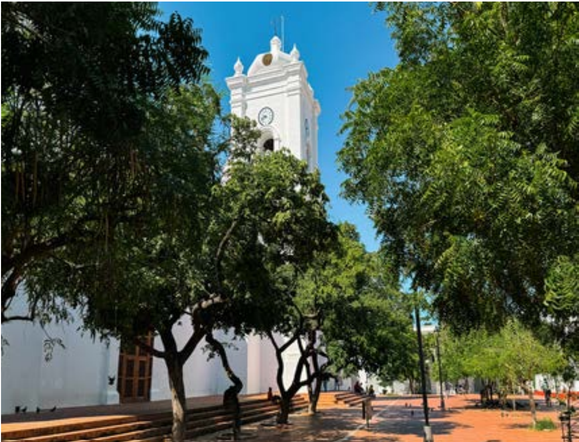
Caminar por sus calles adoquinadas es viajar en el tiempo entre fachadas restauradas que narran historias de piratas, libertadores y una arquitectura que se niega a envejecer.