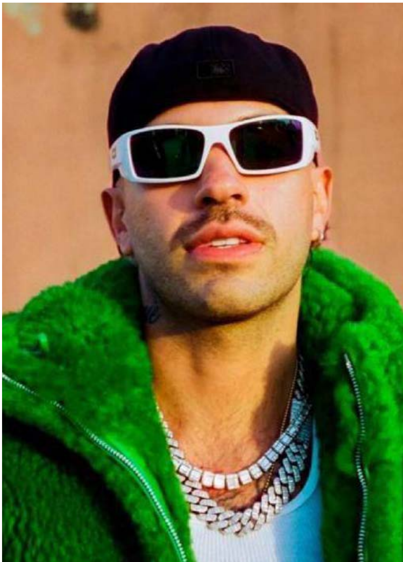
Salomón Villada Hoyos, el Ferxxo

En esencia, Feid se define hoy como un «curador de experiencias», capaz de disolver la barrera entre el ídolo y su audiencia a través de una estética compartida que ya forma parte del zeitgeist contemporáneo.