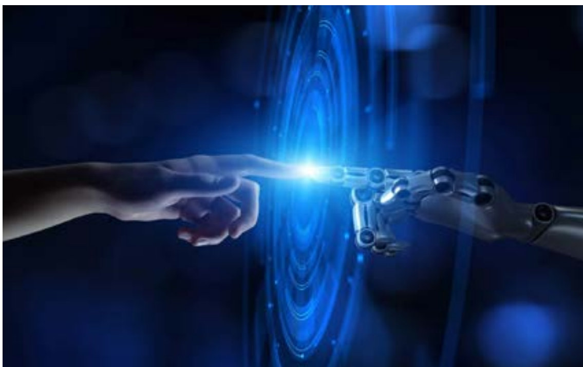
La nueva guerra fría: Silicio e inteligencia

Los proyectos de energía renovable, que dependen de grandes bancos de baterías para estabilizar la red eléctrica, se encuentran suspendidos o desfinanciados debido a la volatilidad extrema del mercado de metales.