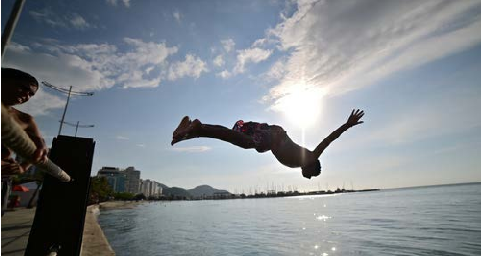
Los niños samarios han convertido el Caribe en su patio de recreo. Con una destreza casi mística, ejecutan acrobacias en el agua que desafían la gravedad, demostrando que en sus venas no solo corre sangre, sino también la maestría de quienes nacieron arrullados por las olas.

Santa Marta es el místico punto de encuentro donde la Sierra Nevada se funde con el Caribe, tejiendo una historia de siglos entre murallas coloniales y arrecifes vírgenes. Como la «Perla de América», ofrece un refugio donde la herencia ancestral de los pueblos de la montaña convive con el ritmo vibrante de una ciudad que abraza el horizonte. Es, en esencia, un santuario de biodiversidad y calma que cautiva los sentidos bajo el resplandor de atardeceres eternos.