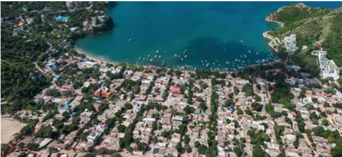
La magia de Taganga trasciende fronteras, consolidándose como un rincón imprescindible que abraza con la misma calidez a propios y extranjeros.