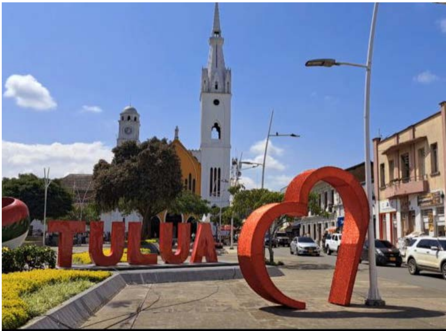
Tuluá se consolidó como el epicentro estratégico y centro de operaciones de la estructura criminal «La Inmaculada».

Lo que inició como una facción siccario en las calles de Tuluá derivó en una organización criminal que redefinió el terror en Colombia: «La Inmaculada». Bajo el mando de los hermanos Marín Silva, esta estructura no solo dominó las rutas del microtráfico, sino que instauró una «dictadura comercial» que alteró drásticamente el costo de vida en el centro del Valle del Cauca.