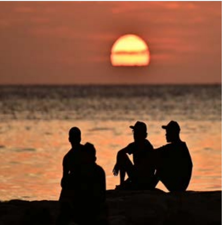
La danza final del sol sobre el Atlántico regala un espectáculo de matices encendidos, recordándonos la belleza indómita de nuestro litoral.