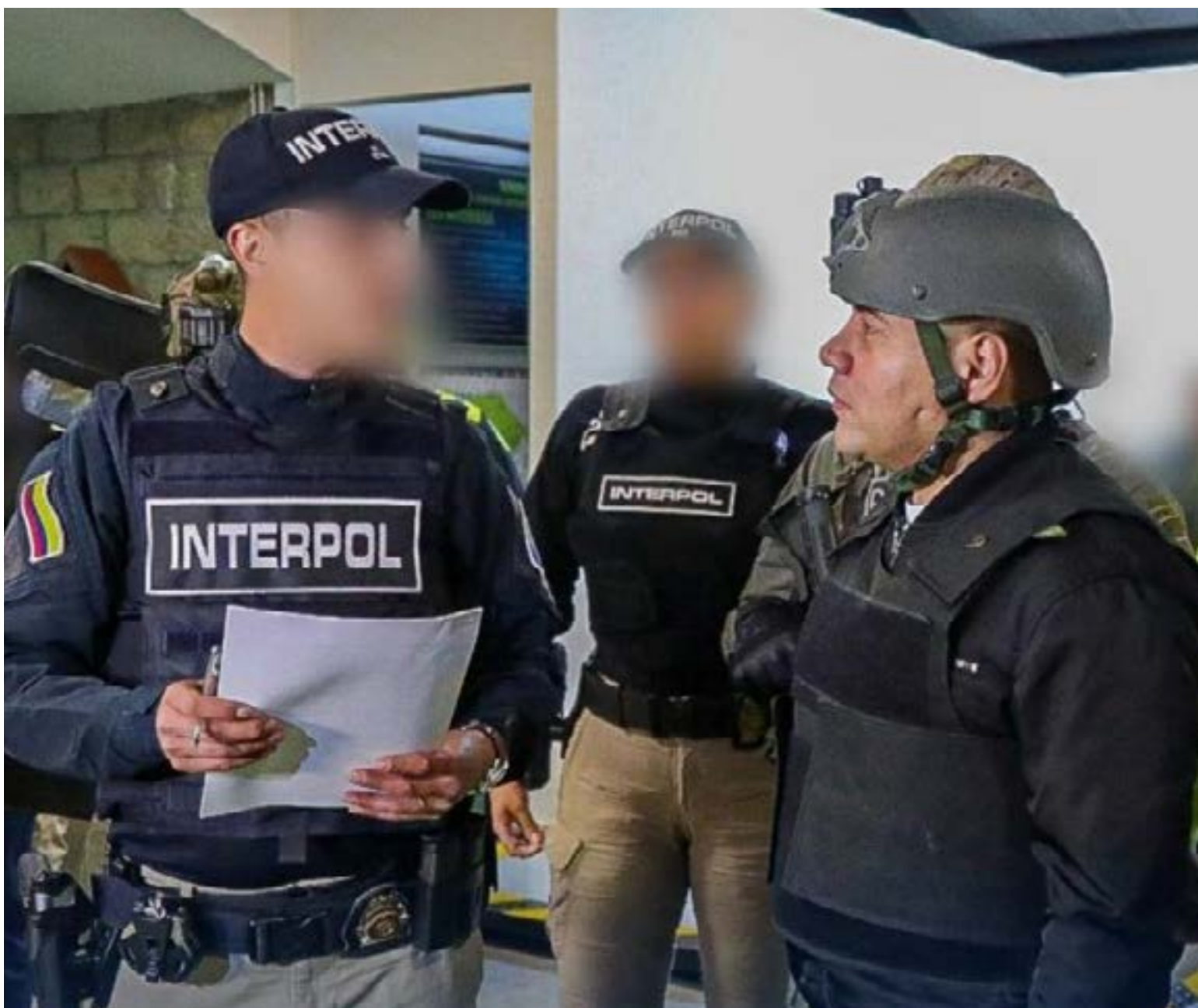
Tras ser entregado por la Policía Nacional a Interpol y posteriormente a la DEA, alias «Pipe Tuluá» ya se encuentra en una prisión estadounidense a la espera de su comparecencia ante un juez federal.

Antes de subir al avión de la DEA a las 4:15 a. m., alias «Pipe Tuluá» emitió un mensaje contradictorio: mientras pedía a sus hombres «no tomar retaliaciones contra el pueblo o el comercio», denunciaba una supuesta «falsa extradición» y un entrapamiento judicial. A pesar de su orden de calma, el centro del Valle del Cauca permanece bajo una «Megatoma de seguridad», con las autoridades en alerta máxima ante posibles reacciones terroristas de una estructura criminal que hoy se queda sin su máximo verdugo.