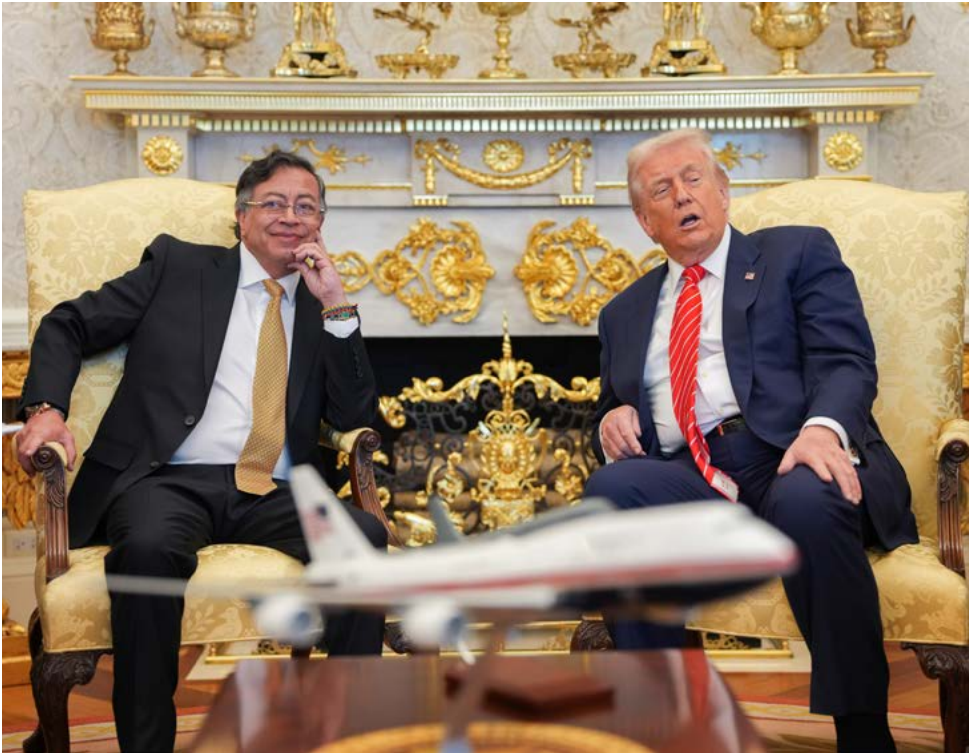
Colombia y Estados Unidos estrechan vínculos estratégicos en una cita histórica de alto nivel