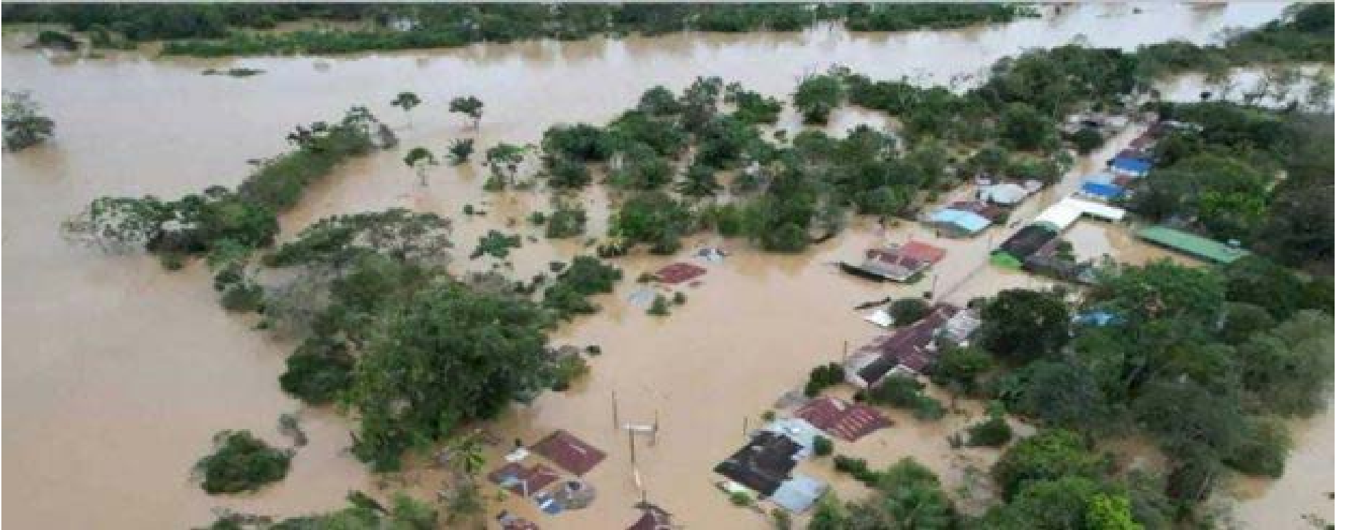
15.000 familias de Córdoba que hoy lo han perdido todo por las inundaciones.