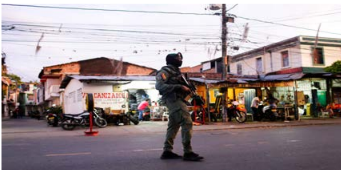
En Tuluá, la banda «La Inmaculada» impuso un régimen de terror donde el precio de la vida se tasaba en apenas 100 dólares por asesinato.

Mediante el control de los denominados «Carteles del Cilantro, la Cebolla y los Huevos», la banda impuso monopo-