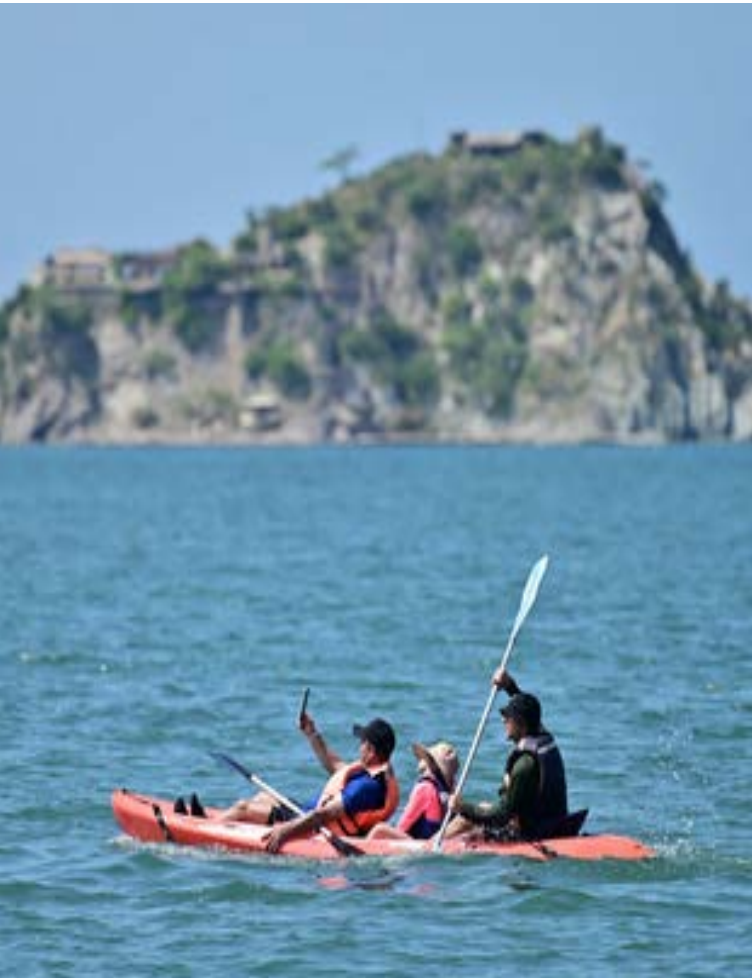
Un recorrido en bote de remos permite contemplar la majestuosidad del Atlántico, fundiendo el horizonte marino con la riqueza paisajística de Santa Marta y su entorno.