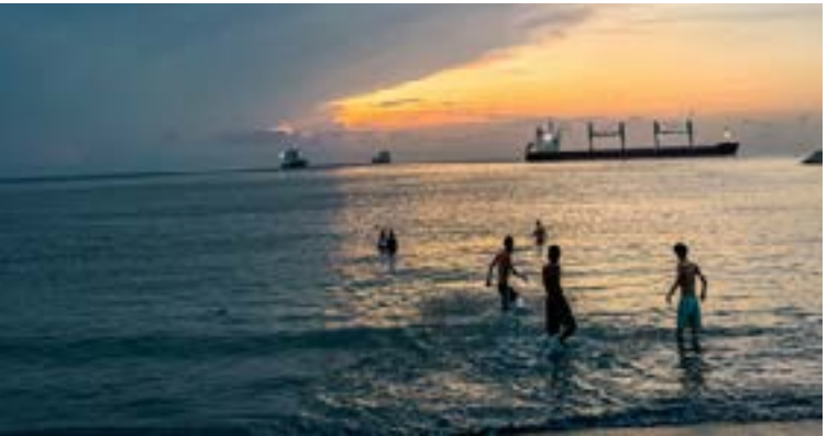
El mar es el santuario universal del disfrute, un regalo de horizontes inagotables destinado a cautivar los sentidos de cada generación.