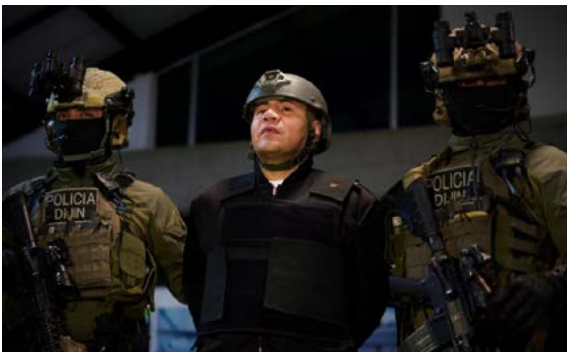
«Alias «Pipe Tuluá» fue entregado esta madrugada a la DEA en el aeropuerto de Catam. Tras ser el máximo verdugo del Valle, ahora enfrentará a la justicia estadounidense por narcotráfico y crimen organizado.

Ante el envío del cabecilla a una corte de Texas por narcotráfico, el presidente Gustavo Petro envió un mensaje contundente: «La paz no se compra, se hace si el corazón la acepta como el camino para acabar la violencia». Con estas palabras, el mandatario dismanteló los intentos del criminal por sobornar funcionarios y evitar su partida bajo la fachada de «gestor de paz». Esta decisión se considera un gesto estratégico de cara a la reunión con Donald Trump en la Casa Blanca, reafirmando que la cooperación judicial no está sujeta a chantajes ni a falsas voluntades de negociación.