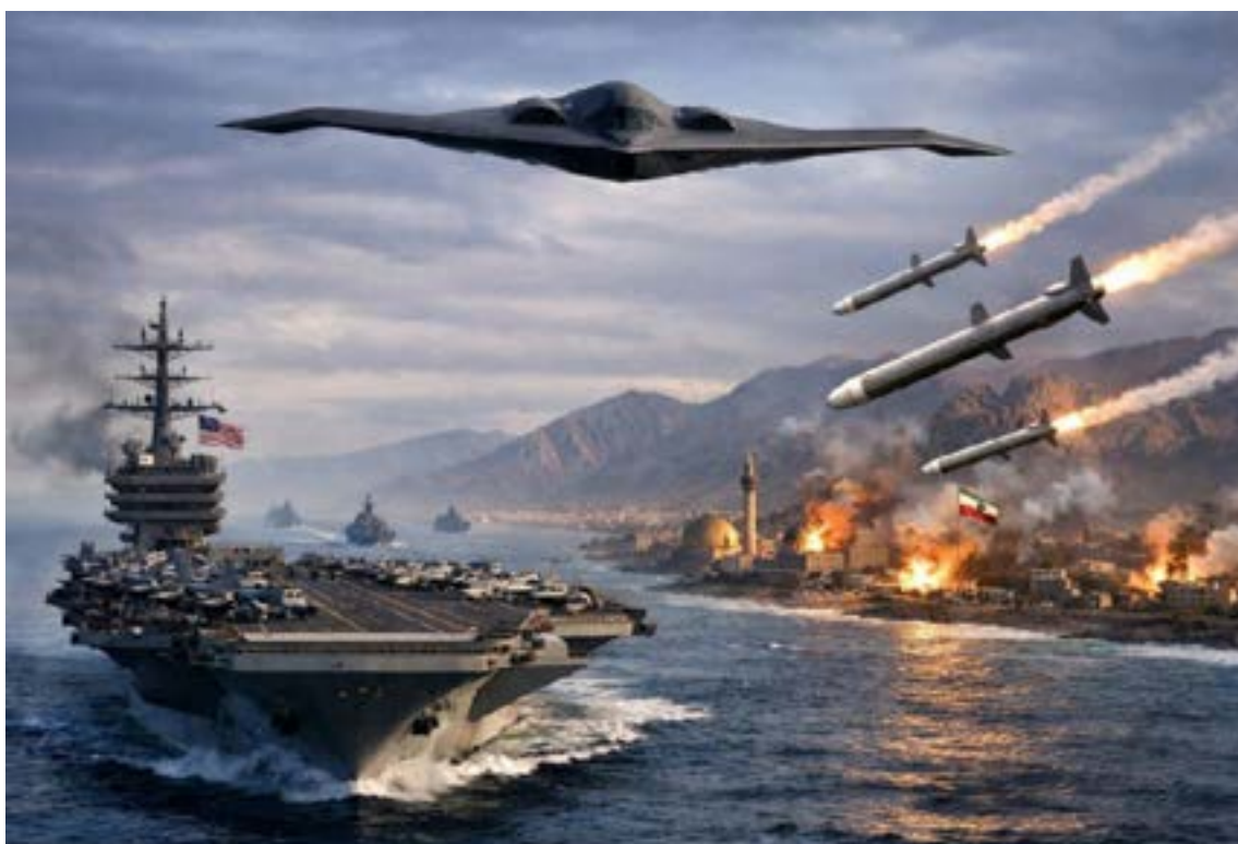
Taiwán encontró una estrategia que ayuda a su supervivencia nacional en este conflicto tan asimétrico y con la que logró alejar el espectro de una invasión china: el llamado «escudo de silicio».

Coaliciones de seguridad La gobernanza del Altiplano ha experimentado un giro drástico con la toma de control físico de salares estratégicos como Uyuni en Bolivia