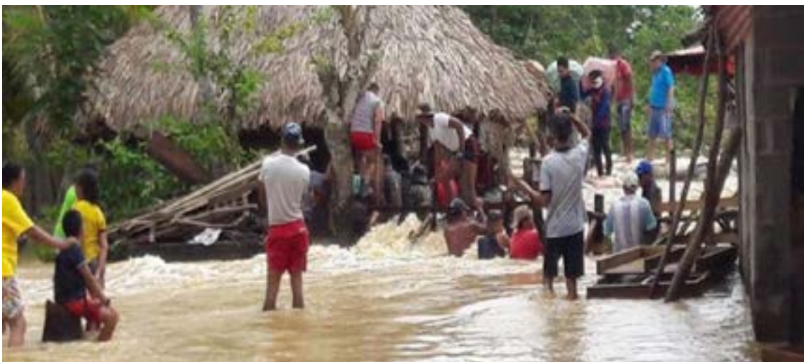
El panorama rural es desolador. El sector agropecuario reporta pérdidas masivas en cultivos de arroz, maíz y plátano, mientras que la ganadería —pilar de la economía cordobesa— enfrenta una crisis logística sin precedentes.

La vulnerabilidad topográfica de Córdoba ha pasado factura. El río Sinú y el río San Jorge, las dos arterias vitales del departamento, presentan niveles críticos que han derivado en el